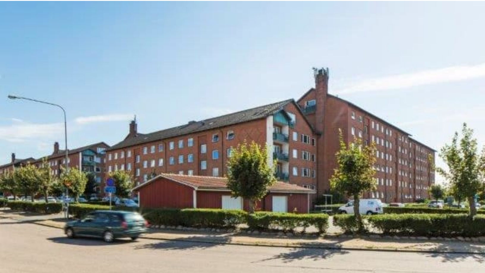
Amasten/Sleipner 6 Helsingborg